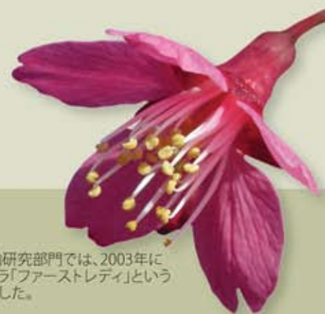
樹木園の園芸植物研究部門では、2003年に濃ピンク色のサクラ「ファーストレディ」という栽培種を開発しました。