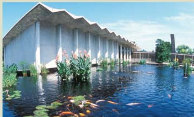
1960年代の設計である本館は、直立する樹木とその枝の広がり表現しています。